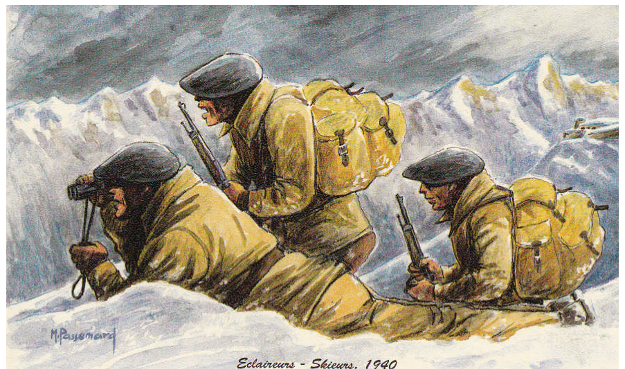
Eclaireurs - Skieurs. 1940