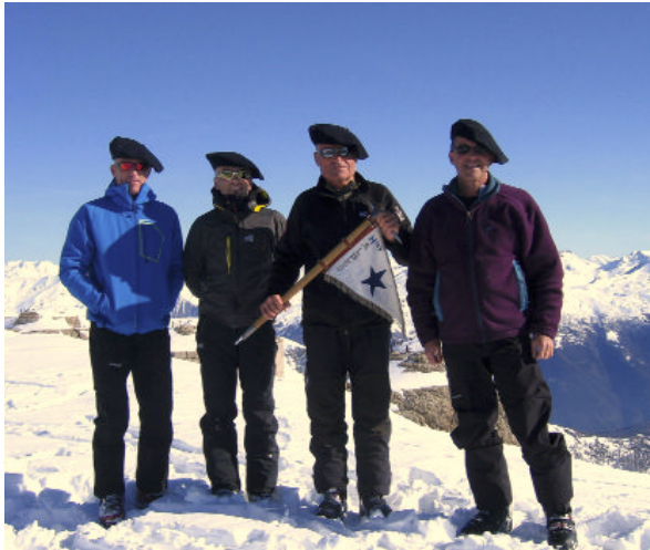
Le Chaberton 3131m le 14 avril 2013

L'assemblée générale, régulièrement convoquée, s'est tenue à la Bergerie à Montgenèvre.