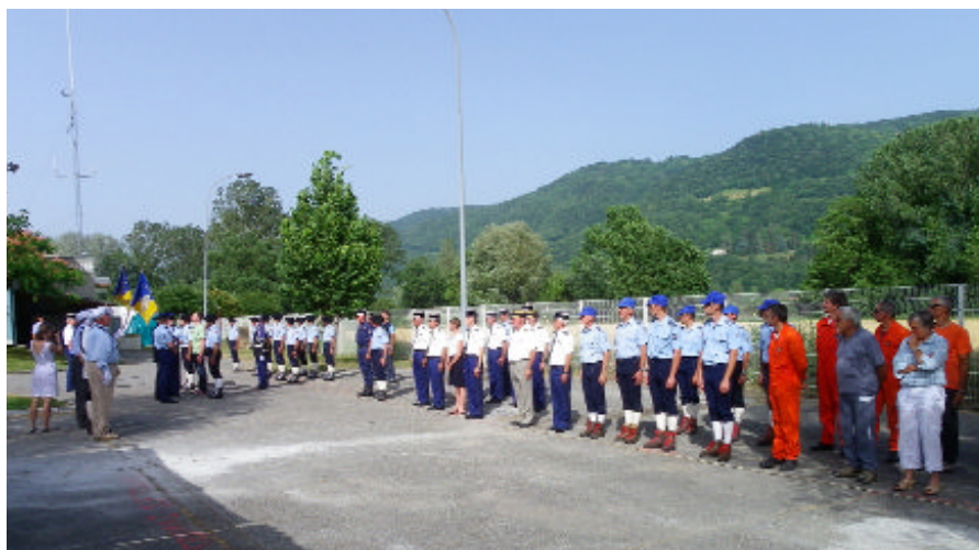
Cérémonie de passation de pouvoir du chef d'escadron, le 29 juin 2012 au Versoud

Les 700 interventions (chiffre moyen 2011 en Isère) du PGHM sont liées à des pratiques sportives dans 54 % des cas, se répartissant ainsi :