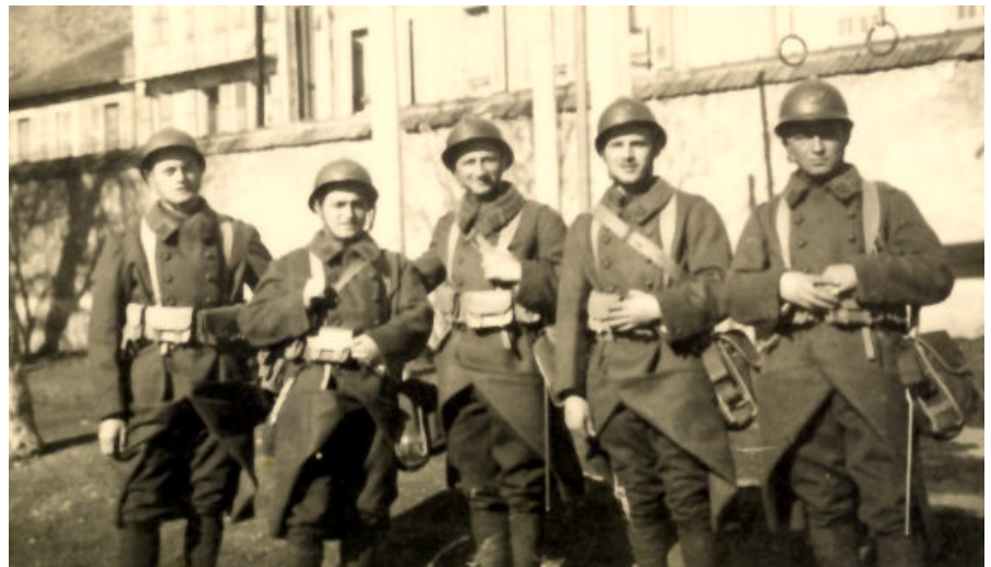
Les bataillons de Chasseurs Alpins

Les positions d'avant-postes qui courent du Col de la SEIGNE au Col de la GALISE en passant par la pointe de LANSBRANLETTE et le Col du MONT étaient marquées par les ouvrages légers de SELOGE et de la REDOUTE RUINEE.