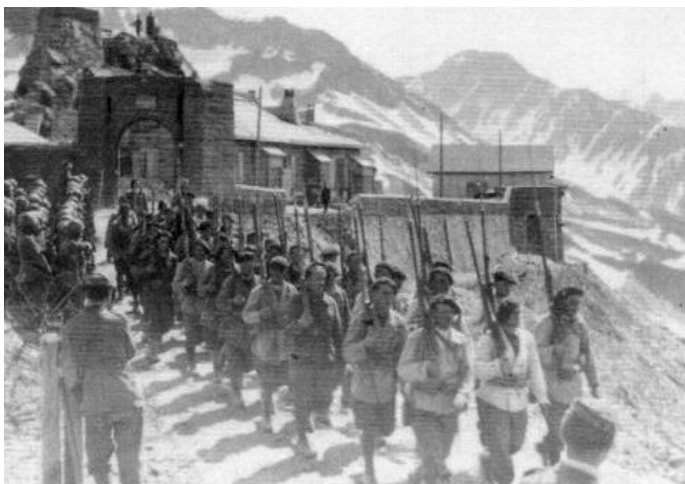
24 juin 1940 : fin de la bataille des Alpes