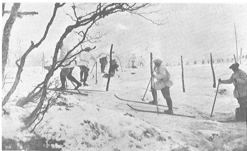
1915 dans les Vosges - Les premières !!! Compagnies de Skieurs.